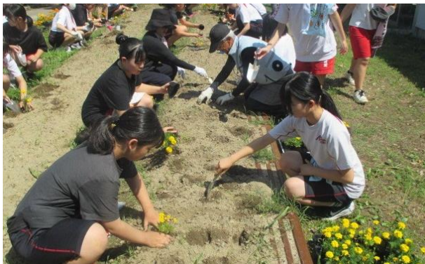
【花苗植え付けボランティア(6/28)】

子どもたちは、地域に支えられながら、地域に根ざして育っています。そしてやがて、地域の一員として、自らも誰かを支える存在へと成長してくれることでしょう。その歩みをともに支えてくださっている保護者の皆様、地域の皆様に、重ねて感謝申し上げますとともに、今後とも変わらぬご協力をよろしくお願いいたします。