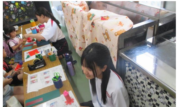
【成岩児童センターまつりボランティア(7/5)】