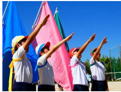
【団長による選手宣誓】