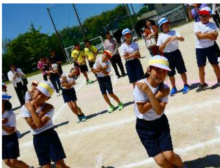
【地域の方と盆踊り】