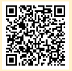
「ラーケーションの日」活動例