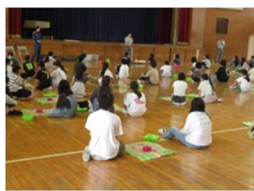
【6月5日】6年救急法訓練

6年生が救急法訓練を行いました。この訓練は、PTA6年委員の方々に計画と運営をしていただきました。ありがとうございました。