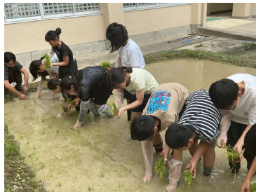
【6月9日・16日】代かき・田植え

6年生が、PTA役員の方々の指導のもと、中庭にある田んぼで9日に代かき、16日にかりやど小町の田植えを行いました。