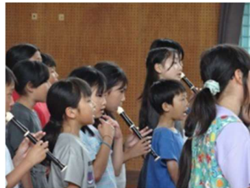
【6月5日】4年ひいらぎ特別支援学校との交流

4年生が、ひいらぎ特別支援学校に出向いて交流を行いました。子どもたちは、楽器を演奏するなどして和やかに交流しました。