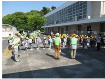
【5月15日】下校支援ボランティア最終日

かりやど応援隊のみなさんによる1年生下校支援ボランティアの最終日でした。応援隊の皆様、ありがとうございました。