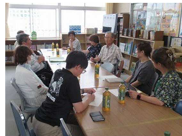
【6月11日】エプロン先生反省会

児童支援をしてくださっているエプロン先生の反省会を行いました。今後のよりよい活動のための話し合いができました。