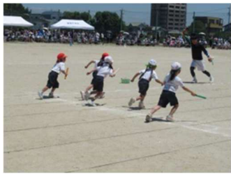
【5月30日】ふれあい運動会

教育委員会の方々が来校されました。全学級の授業で、子どもたちがいきいきと学ぶ姿をご覧いただきました。