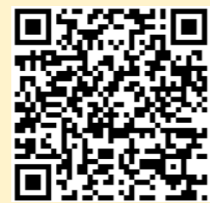
「ラーケーションの日」保護者用リーフレット