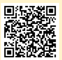
「ラーケーションカード」(小中学生用)

あいちけん ベーじ ら-け-しょん ひ ぽ-た-る-さいと まな 愛知県のWebページ「ラーケーションの日」ポータルサイトには、学 びを体験できるスポットや、計画に役立つ「ラーケーションカード」 しょうかい などを紹介しています。