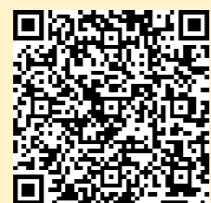
「ラーケーションの日」ポータルサイト